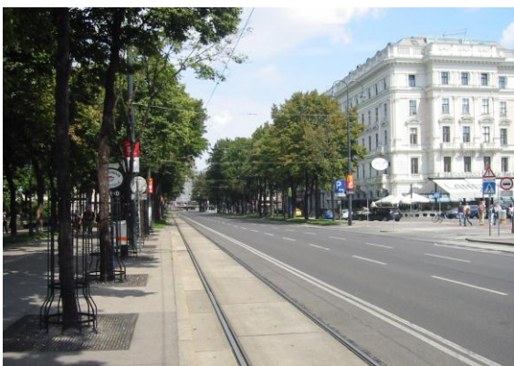
Ringstrasse tussen Raadhuis en Burgtheater

En er om half 7 weer uit, half 8 ontbijten en om 9.00 uur de bus weer in om naar Wenen te gaan waar we een gids oppikten voor een stadsrondrit in combinatie met een wandeling.